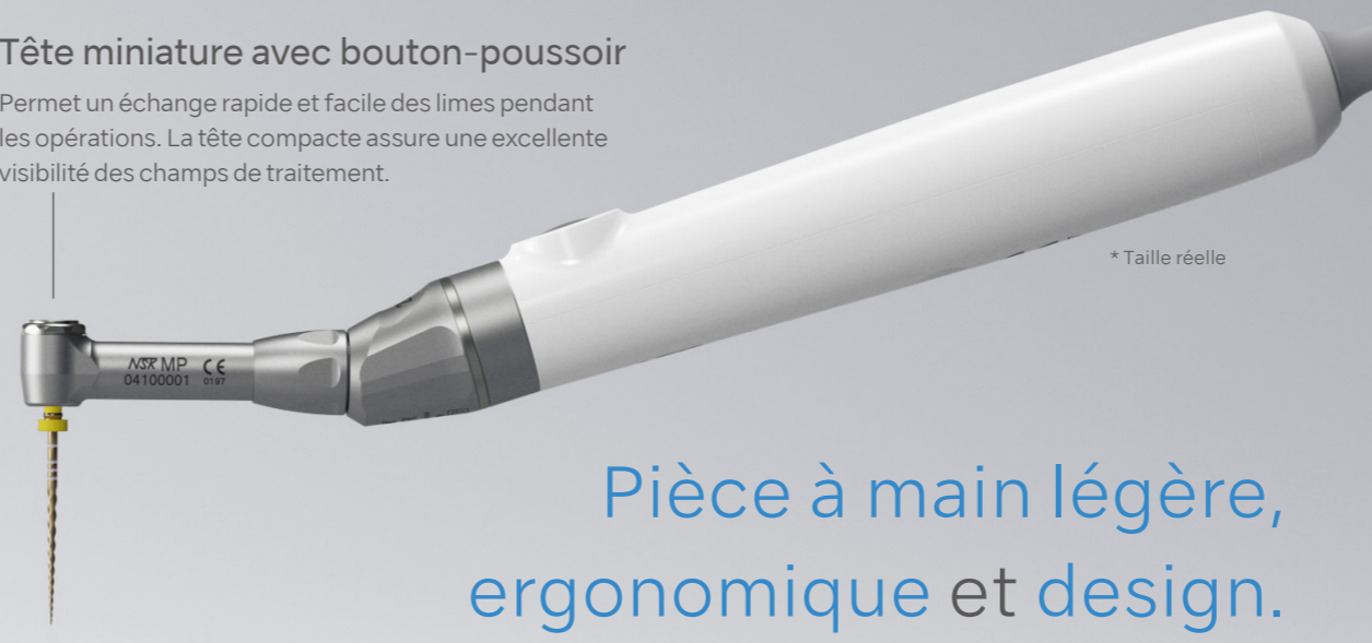
* Taille réelle

Permet un échange rapide et facile des limes pendant les opérations. La tête compacte assure une excellente visibilité des champs de traitement.