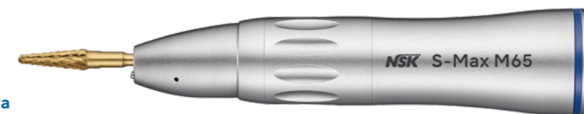
Peça de Mão Reta