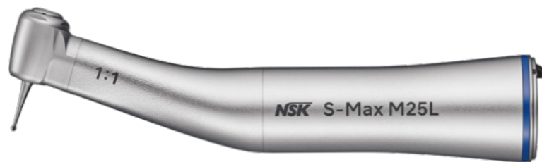
Velocidade Direta 1:1

COM LUZ MODELO: M25L CÓDIGO DE ENCOMENDA: C1024